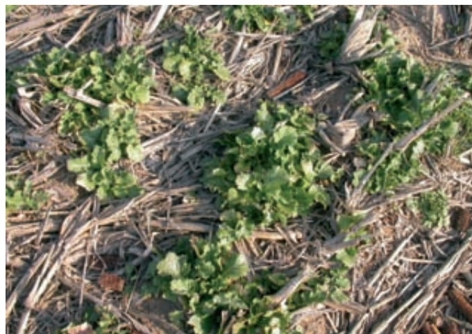
Foto 4 (izquierda). Detalle del cultivo de colza forrajera. Foto 5 (dcha.). Detalle de la parcela de ensayo con adventicias espontáneas.