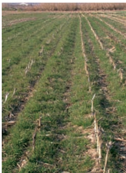
Foto 3. Aplicación de purines al suelo como abonado nitrogenado para el cultivo del maíz.

- En rotaciones de cultivos con maíz donde se aplican cantidades elevadas de N (deyecciones ganaderas, lodos de depuradora, abono mineral), puede ser más necesario implantar CCN que en sistemas donde las entradas de N son