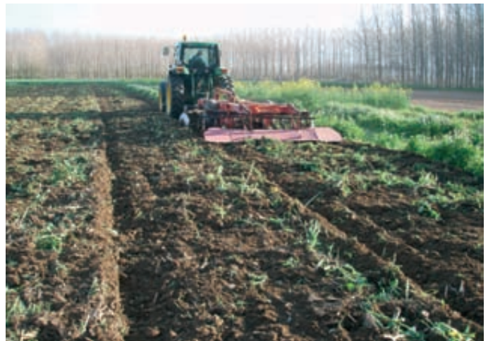
Fotos 6 y 7. La finalización o enterrado del CCN depende del momento de la siembra del siguiente cultivo, de la desecación del cultivo, de su producción de biomasa y de su estadio de desarrollo.

discos posterior. En otros lugares se han probado sistemas de siembra alternativos: a granel al mismo tiempo que se recolecta el cultivo anterior, con pequeñas modificaciones de la maquinaria convencional; siembra en el momento del abonado de cobertera del cultivo anterior y, por lo tanto, antes de la recolección del cultivo principal, etc.