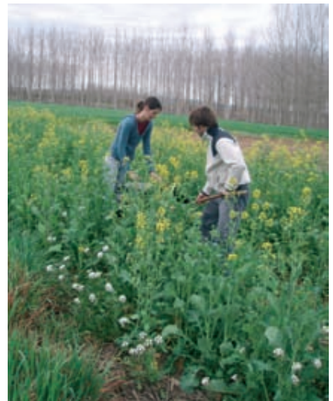
Fotos 1 y 2. Vistas generales de los ensayos en diferentes momentos de desarrollo de los CCN (colza forrajera, avena y adventicias espontáneas).

De forma tradicional se han sembrado leguminosas (p.ej.: vezas) en períodos sin cultivo para incorporarlas al suelo al llegar al estadio de floración y realizar así un abonado en verde. Estas prácticas, no obstante, no tienen como objetivo extraer el nitrógeno del suelo y evitar el lavado, sino que captan N atmosférico y enriquecen el suelo en N. Es una técnica que se suele utilizar en situaciones de poca disponibilidad de N en el sistema y no se consideran CCN.