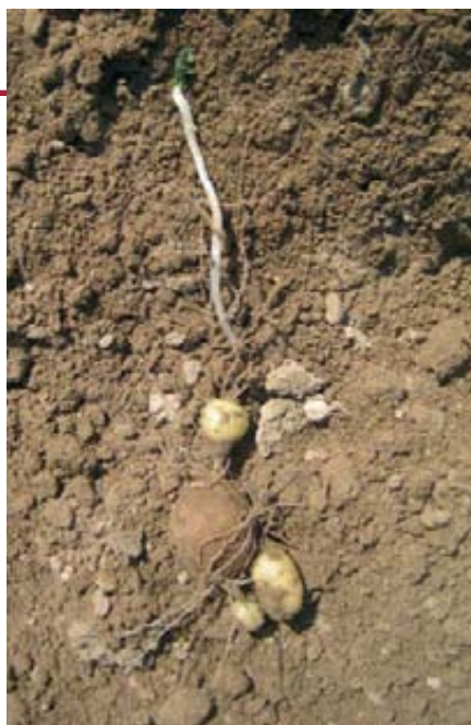
Daños por clorpropham en la semilla.

Sin embargo, proponen en Bruselas ser cada vez más exigentes en cuanto a las virosis, porque por sus condiciones climáticas y orográficas tienen muy poca presión de los pulgones transmisores de virus; unas condiciones