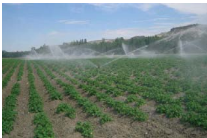
El riego es imprescindible en nuestro país.