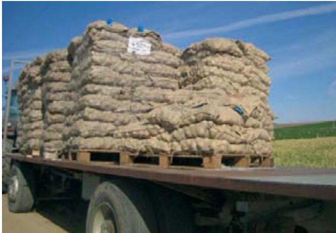
Patata de siembra paletizada.