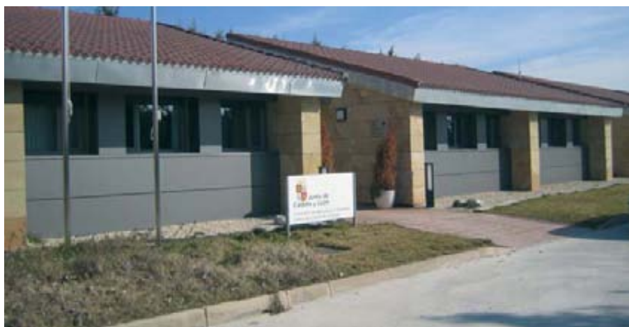
Centro de Control de la Patata de Castilla y León.

Hay que tener en cuenta que, en 1986, año de nuestra entrada en el Mercado Común Europeo y en el que no se importaba patata prácticamente, el consumo per cápita de patata en España era de 56 kg anuales.