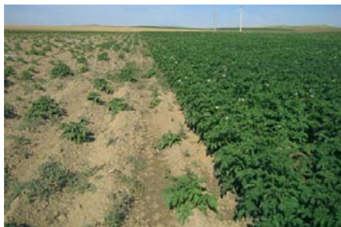
Diferencia entre usar una buena y mala semilla.

En cuanto a la producción de fécula o almidón de patata, aunque en el pasado hubo dos fábricas ubicadas en Santo Domingo de la Calzada (La Rioja) y Astudillo (Palencia), desde hace unos cuantos años, en España no se extrae ni un solo kilo de este producto, dependiendo sus múltiples usuarios de las importaciones. Tradicionalmente estas dos fábricas trabajaban con los destríos o subproductos originados en el calibrado de la patata tanto de consumo como de siembra o bien con partidas de patata que no eran comercializables como tales. En Europa se plantan para esta producción variedades específicas ricas en fécula.