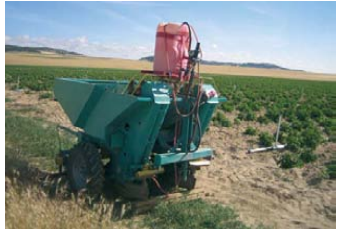
Plantadora de patata con aplicador de insecticida.

tor español de patata de siembra no produce los calibres que requiere el productor de patata de consumo. Éste, prefiere pagar precios mucho más elevados por calibres menores, que le ofrecen en otros países europeos. Otro problema es el de no disponer de variedades propias, por lo que nos tenemos que limitar a multiplicar variedades libres, ya que es difícil conseguir una licencia de explotación de variedades protegidas.